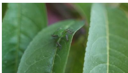
Fig. 1 Cimice asiatica