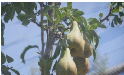
Fig. 1 Pere coperte dalle reti prima della raccolta Fig. 2 Vista aerea dell'impianto Fig. 3 Trappola massale