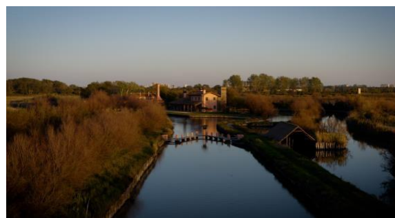
Fig. 4 Società Agricola Valle Pantani

L'azienda Valle Pantani si trova a Lignano Sabbiadoro, nella zona sud della Laguna di Grado e Marano. È una proprietà di 150 ettari circa. Di questi, circa 120 sono in "Valle", ovvero una porzione di laguna chiusa, condizione necessaria per poter allevare il pesce in libertà. Nel 2015, l'azienda ha deciso prima di avviare l'allevamento e l'anno dopo di certificarsi biologica. Il pesce, una volta seminato, comincia il suo percorso di vita, viene lasciato in libertà, si alimenta con il pesce che entra dal mare o con delle integrazioni che vengono fornite al bisogno. L'azienda è una delle poche realtà ittiche certificate bio e la prima del Friuli