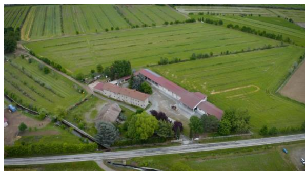
Fig. 3 Una Garlanda – Panoramica aziendale

L'azienda Agricola "Una Garlanda" è sita nel Parco della Baraggia, comune di Rovasenda, in provincia di Vercelli, importante areale produttivo risicolo. L'azienda è nata nel 1938 e nella sua lunga storia ha affrontato i diversi passaggi dall'agricoltura preindustriale, alla rivoluzione verde per poi riavvicinarsi alla tradizione. Dalla fine degli anni 90 l'azienda abbandona la monocoltura per sperimentare tecniche agroecologiche. Dal 2001 l'azienda è certificata bio. La conversione è stata fatta per step così da evitare scossoni che potessero di colpo impattare sull'economia.