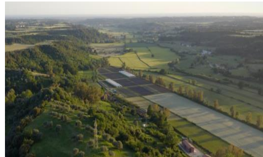
Fig. 3 Azienda Agricola Solaria – Panoramica aziendale

L'azienda agricola Boccea, a vocazione prevalentemente zootecnica, con una superficie complessiva di 270 ettari si trova all'interno del Comune di Roma, e dal 2005 è un'azienda biodinamica dove vengono allevati 300 capi bovini. Per l'alimentazione bovina sono auto prodotti ortaggi e cereali. Inoltre, dal 2007, l'azienda ha iniziato la produzione di ortaggi biologici nell'ottica della multifunzionalità con una superficie investita di 4 ettari. La certificazione biodinamica infine ha consentito l'accesso a nuovi mercati e il rafforzamento della filiera corta e della vendita diretta.