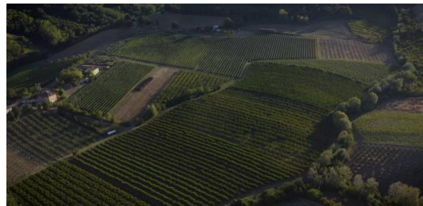
Fig. 4 Tenuta Pedrini – Panoramica aerea sui frutteti

L'azienda agricola Tenuta Pedrini è specializzata nella coltivazione di frutteti misti (ciliegio, pesco, albicocco, susino). Biologica dal 1994, per scelta etica, oggi dopo anni di sperimentazioni di campo ha raggiunto un'esperienza tale da consentire una riduzione pressoché totale dei trattamenti fitosanitari, anche con i prodotti ammessi in biologico.