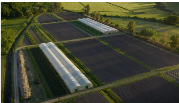
Fig. 1 Vista dall'alto dell'orto