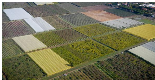
Fig. 3 Azienda Agricola Dell'Olmo – Panoramica aziendale

La Società Agricola dell'Olmo si trova a Cisterna di Latina, nelle campagne laziali. La superficie è di dieci ettari ed è coltivata per cinque ettari con kiwi giallo e cinque con kiwi verde. L'azienda è biologica dal 1996. Nel 2012, i proprietari hanno avviato la coltivazione del kiwi giallo convertendo parte del kiwi verde ormai in sovrapproduzione.