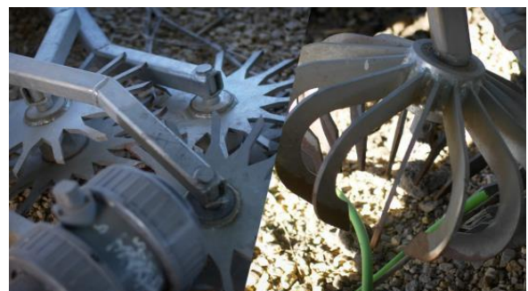
Fig. 2 Sarchiatrici per la gestione delle malerbe