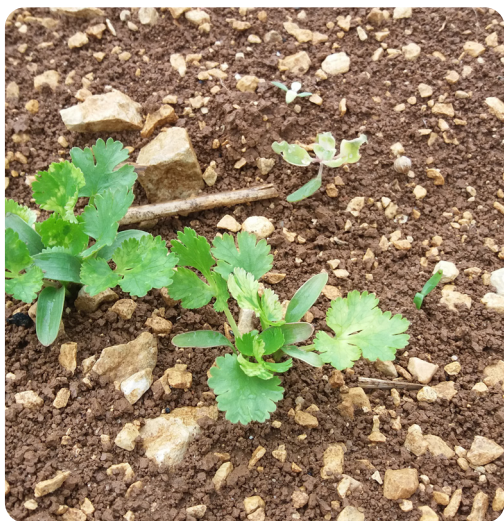
Levée des plantules de coriandre.

La coriandre a un besoin modéré en phosphore et potassium. Ils sont de l'ordre de 40 à 60 kg/ha. Ils peuvent être raisonnés en fonction de l'analyse de sol.