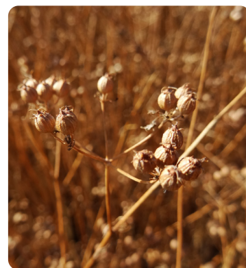
Les graines ont viré au marron clair, les tiges sont sèches, c'est le bon stade pour la récolte.