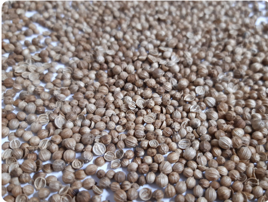
La semence de coriandre est fragile et se casse facilement en deux à la récolte

Etendre ou ventiler les graines dès la récolte terminée pour refroidir le lot et stabiliser son humidité autour de 9% (norme d'humidité maximum des semences à l'agréage). Cela permettra de préserver la faculté germinative des semences.