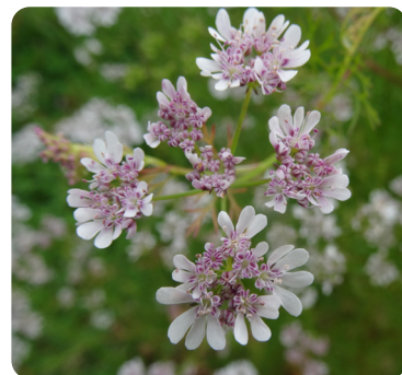
Floraison de coriandre

Les fleurs de coriandre, à 5 pétales de couleur blanche à rose pâle, sont organisées en ombelles, hermaphrodites. Les nectaires floraux sécrétant du nectar attirent les pollinisateurs (abeilles domestiques et pollinisateurs sauvages). La pollinisation est optimale 2 à 3 jours après l'ouverture des premières fleurs, lorsque les sacs polliniques virent au rose ou violet et que les deux pistils s'allongent pour se séparer en leur partie apicale. Cette période optimale de pollinisation dure au maximum 5 jours à l'échelle de la fleur.