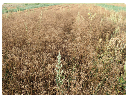
Salissement tardif par du chénopode

À noter que la réussite de faux semis est limitée compte tenu des conditions climatiques lors du semis de la coriandre (sol froid).