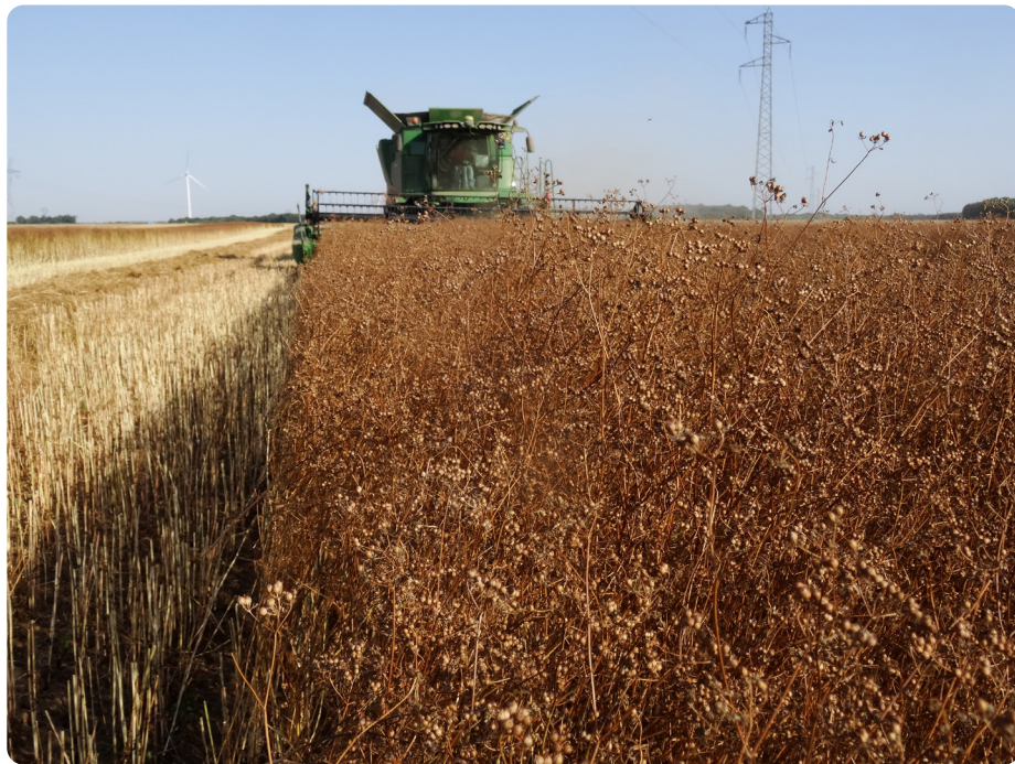
Récolte d'une parcelle de coriandre porte-graine à maturité

La faculté germinative minimale n'est pas fixée actuellement dans la convention-type mais la norme de 80 % est couramment demandée par les établissements.