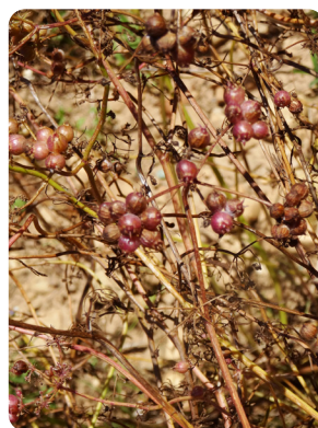
Les graines commencent à prendre une couleur violette, c'est le début de la maturation des graines.

Il est possible de pré-nettoyer les lots produits en utilisant un pré-nettoyeur équipé d'une grille supérieure à perforations rondes de 6,5 mm de diamètre, et d'une grille inférieure aux perforations oblongues de 1 à 1,2 mm de large.