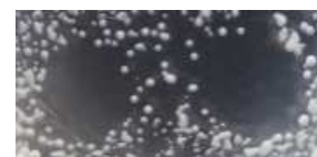
Attività dei Sali di rame vs Xap (sin); ( 10^8 ufc/ml); sost. nat. vs Xap, (ds.).