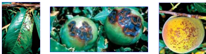
Danni causati da Xap su foglie (pesco) e frutti (susino e pesco).

Xanthomonas arboricola pv. pruni (Xap) determina danni di rilevanza economica a carico di differenti Drupacee (susino, pesco, albicocco). La gravità di questa batteriosi si evidenzia con uno stato di stress complessivo della pianta dovuto alla formazione di cancri rameali, spesso in prossimità di gemme morte o tagli di potatura mal gestiti, con lo sviluppo di maculature fogliari in grado di determinare anche una filloptosi anticipata e, sui frutti, con la formazione di tacche necrotiche e la riduzione della dimensione e della commerciabilità.