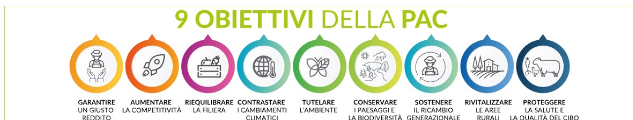
Fig. 2 - Obiettivi della nuova PAC

A loro volta, tali obiettivi si articolano in nove obiettivi specifici (fig. 2).