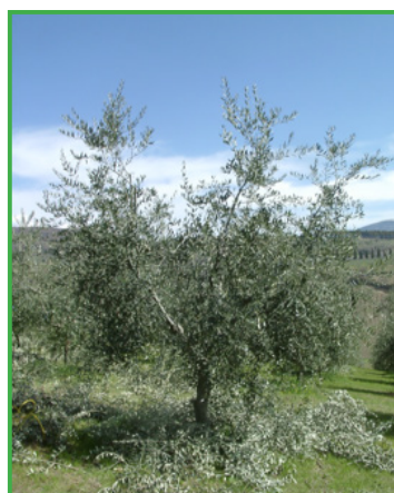
Vaso policonico a chioma libera

Forme ad asse centrale richiedono maggiori attenzioni ma possono comunque assicurare ottimi risultati produttivi se ben gestite.