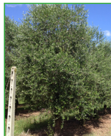
Monocaule a chioma libera