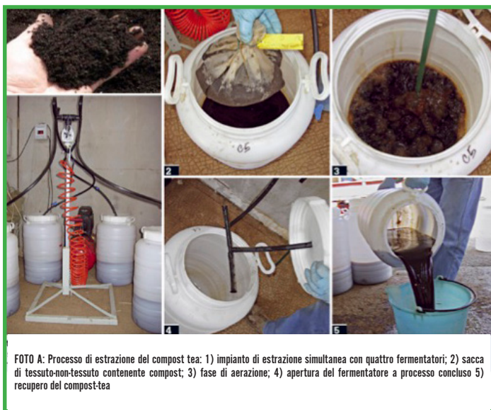
FOTO A: Processo di estrazione del compost tea: 1) impianto di estrazione simultanea con quattro fermentatori; 2) sacca di tessuto-non-tessuto contenente compost; 3) fase di aerazione; 4) apertura del fermentatore a processo concluso 5) recupero del compost-tea

3 Il tè di compost deve essere utilizzato in campo diluendolo 10 volte in acqua e può essere impiegato sia per trattamenti fogliari che per trattamenti al suolo, così da essere assorbito dalle radici. E' consigliabile ripetere i trattamenti ogni 7-10 giorni ed eseguirli nelle ore meno calde della giornata.