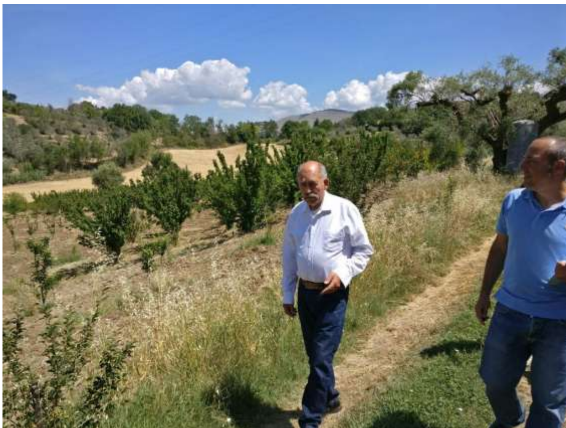
Fig. 21 - Visita Azienda Spagnoli