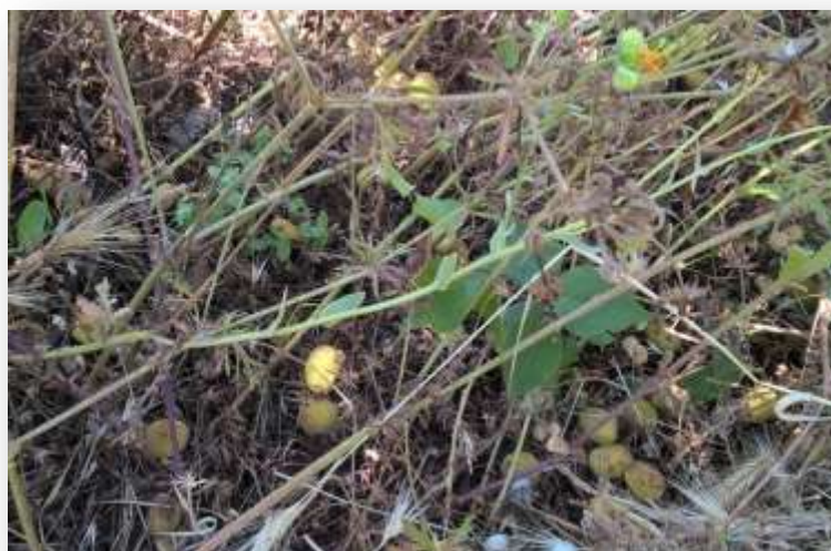
Fig. 15 - Cascola dei frutti