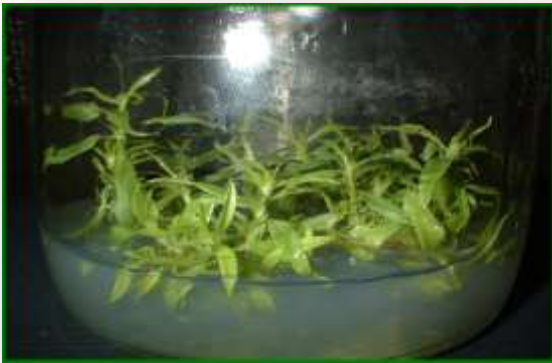
Fig. 16 - Moltiplicazione del GF677

L'allestimento della coltura in vitro della cv. San Castrese è giunta alla fase di moltiplicazione. Maggiori difficoltà sono state incontrate per le altre due cultivar a causa di fenomeni di necrosi che bloccano lo sviluppo degli apici vegetativi.