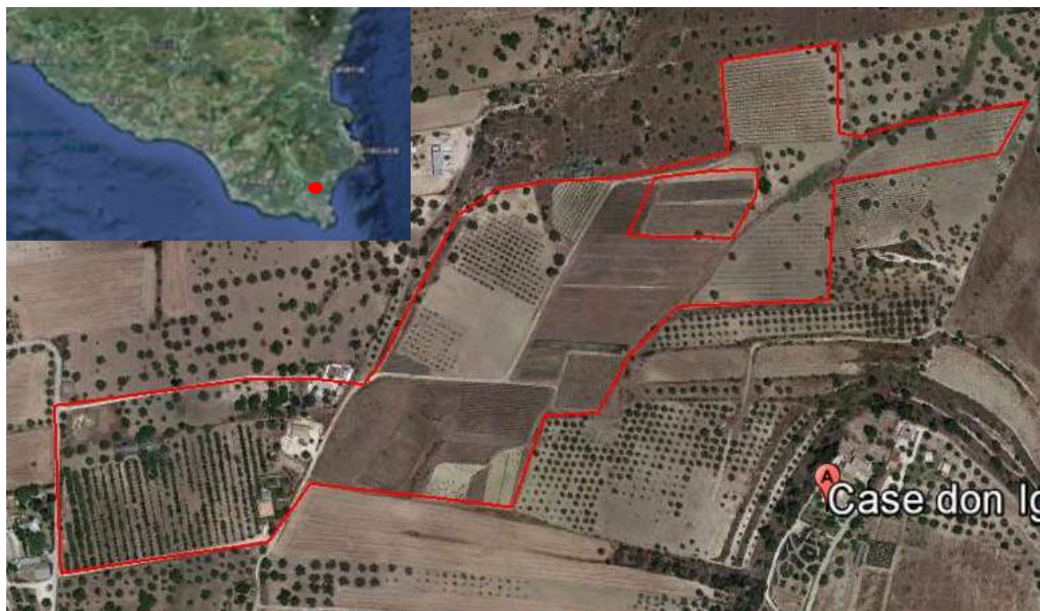
Fig. 1 - Ubicazione dell'azienda Valle del Tello e identificazione dell'appezzamento scelto per il campo di valutazione