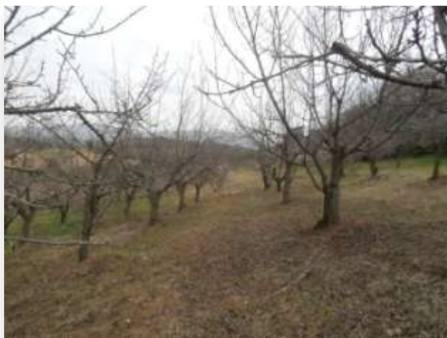
Fig. 13 – Ciliegeto dell'Azienda Biologica Spagnoli di Nerola

Linea di ricerca b) “Valutazione delle caratteristiche qualitative in albicocche ottenute in regimi biologico e integrato”