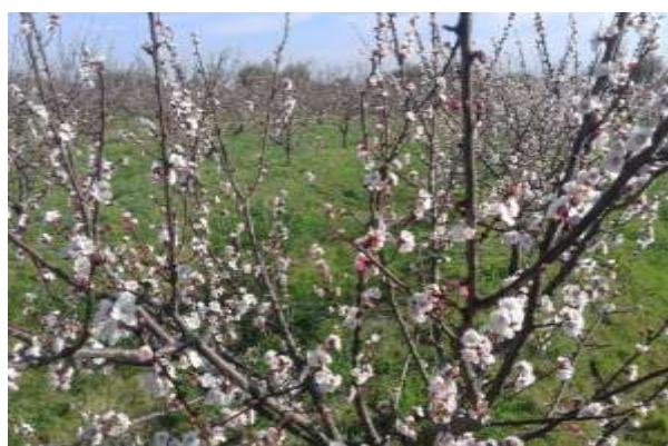
Fig 12 - Particolare della fioritura della cultivar Tsunami