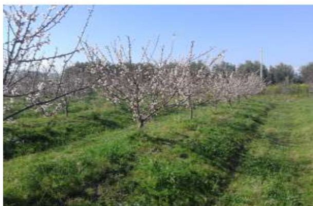
Fig 11 - Panoramica dell'azienda Poggiobianco (CT) con letti rialzati

Inoltre, con la pratica dei carotaggi, si effettueranno prelievi di terreno in periodi dell'anno stabiliti per condurre lo studio dello sviluppo degli apparati radicali delle piante sottoposte ai due trattamenti. In merito a questa attività è già in corso una collaborazione con gli altri partner del progetto coinvolti nel medesimo WP con l'obiettivo di rendere omogenei i protocolli e ottenere risultati confrontabili anche se in ambienti pedoclimatici differenti.