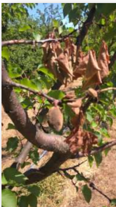
Fig. 14 - Danni da freddo su albicocche

coltivate, nello stesso ambiente pedoclimatico in distinti campi, in regime biologico e integrato. Le attività iniziali della ricerca hanno riguardato l'esecuzione di rilievi mirati a valutare l'entità della produzione dell'anno che si annunciava consistente per un discreto numero di cultivar. Tuttavia, l'inattesa gelata tardiva avvenuta nella campagna laziale nella notte tra il 21 e 22 aprile scorsi (la stazione meteo posta in campo ha registrato temperature al di sotto dello zero per oltre sei con punte di -2\text{ }^{\circ}\text{C} ) ha causato irreparabili danni ai frutticini da poco allegati compromettendone seriamente il proseguimento del loro sviluppo (Fig. 14), se non determinare addirittura la loro cascola (Fig. 15). Per questo motivo è stato possibile raccogliere solo campioni in quantità sufficienti per le analisi per un ristretto numero di varietà rispetto a quello ipotizzato inizialmente. In particolare sono stati raccolti e conservati saggi per le cultivar Bella d'Imola, Bora, Magic Cot, Procida, Spring Blush, Thyrinthos, Vitillo, sia di produzione biologica che integrata, che sono stati subito processati per le analisi chimico-fisiche e carpometriche eseguite su "frutto fresco" e la preparazione di campioni da conservare a temperatura di -80\text{ }^{\circ}\text{C} che saranno utilizzati per le determinazioni analitiche qualitative e quantitative in programma nei prossimi mesi.