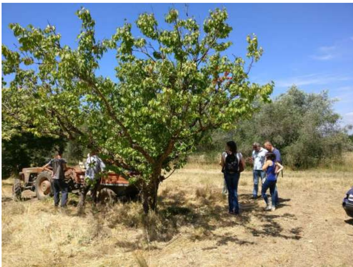
Fig. 22 – Visita Azienda Co.Br.Ag.Or.