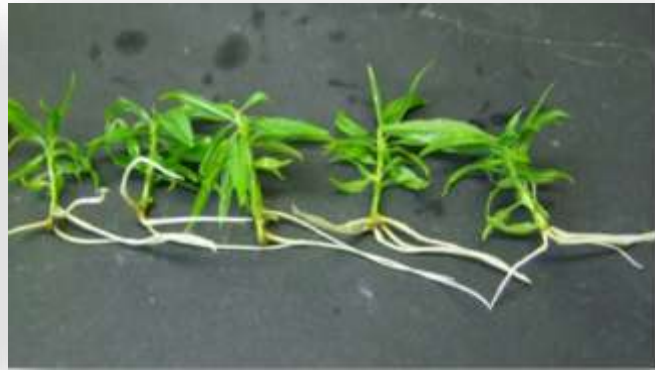
Fig. 17 - Radicazione in vitro del GF677