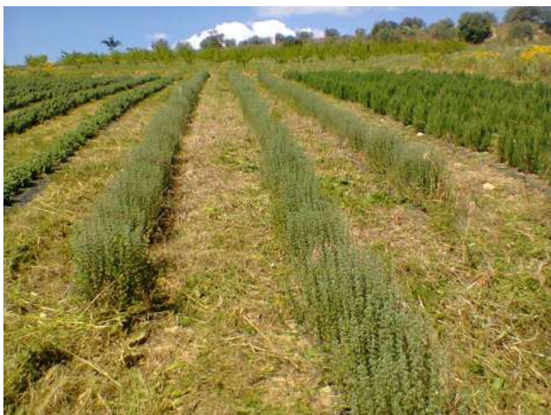
Fig. 3 - Essenze officinali coltivate nell'Azienda Valle del Tellarò