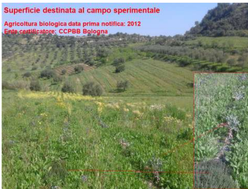
Fig. 2 - Azienda Valle del Tello. Particolare dell'appezzamento scelto per l'impianto del campo di valutazione attualmente sottoposto a consociazione tra cavolo vecchio di Rosolini e timo.