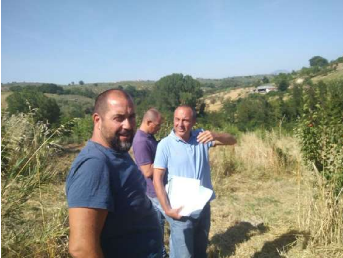
Fig. 20 – Visita Azienda Renzi

Giugno 2017 : si condivide la scelta varietale con gli agricoltori e si fanno dei sopralluoghi presso le aziende per individuare il miglior sito per l'impianto sperimentale principale. In occasione di ogni visita, c'è uno scambio informale di esperienze ed emergono le criticità sulla gestione del futuro impianto presso alcuni agricoltori.